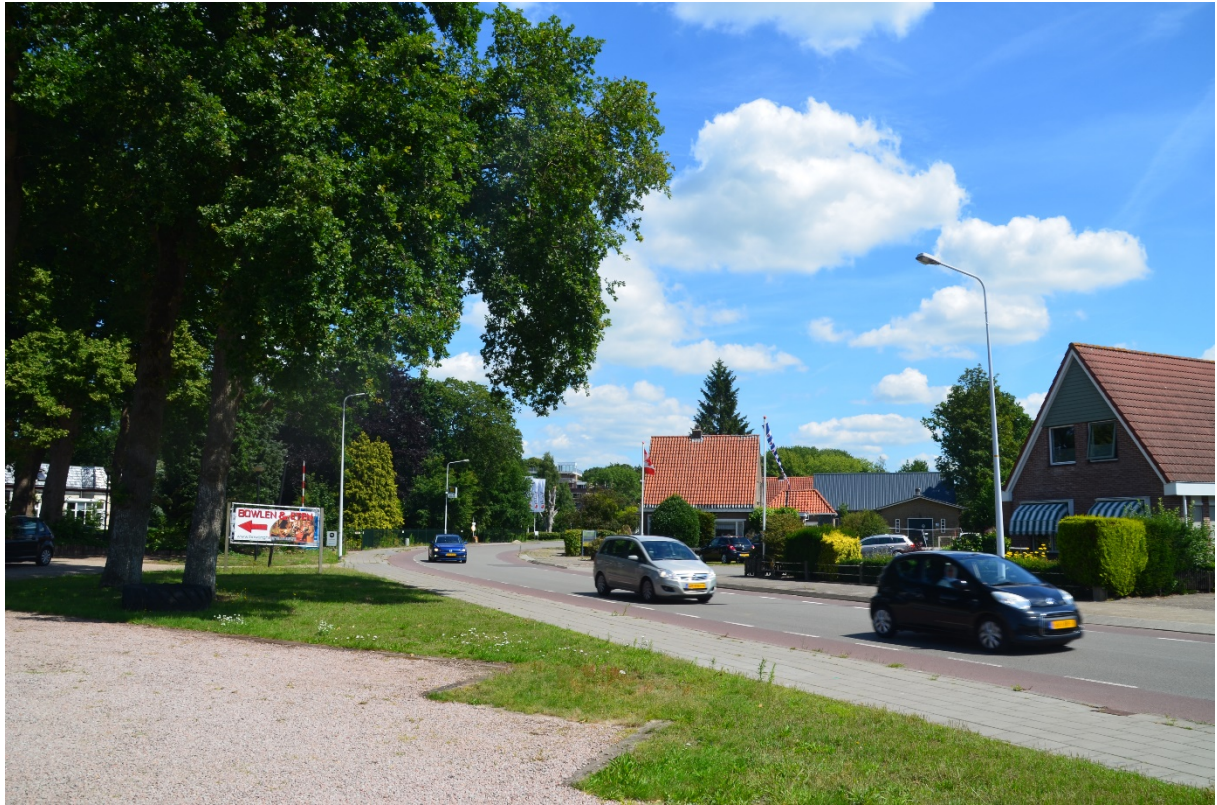
Zicht op de Heremaweg